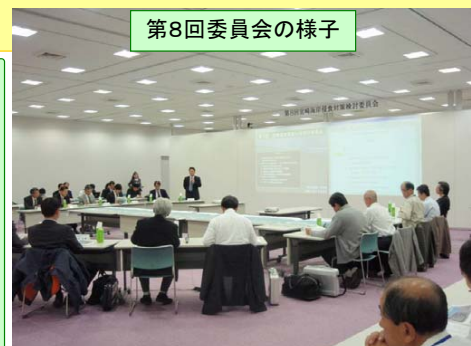
第8回委員会の様子