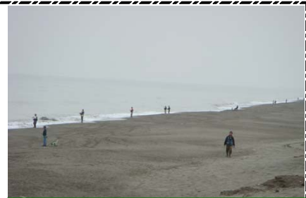
早朝から釣り人ぞらり！！