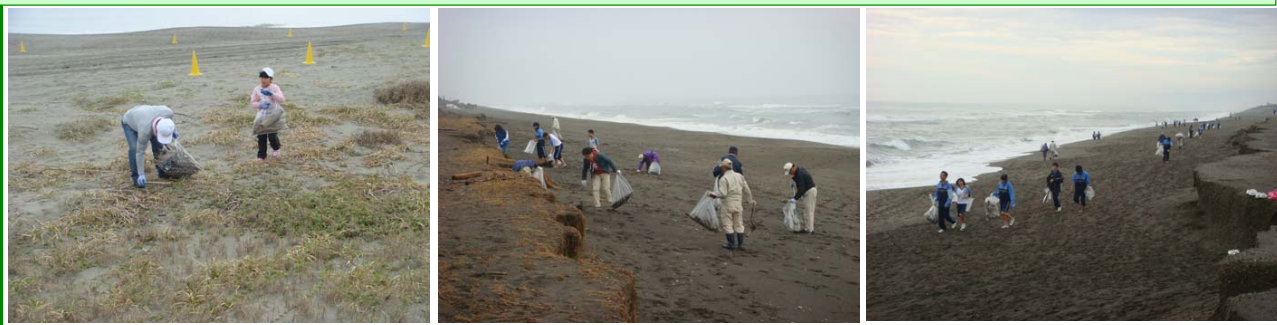
【 海岸清掃の様子 】 左：石崎浜 (H22. 11. 13撮影) / 中・右：動物園裏 (H22. 11. 14撮影)

また、11月14日(日)の市民一斉清掃で動物園裏の海岸清掃が行われるなど、地域のみなさんの様々な活動により、砂浜はだいぶんきれいな姿を取り戻してきました。