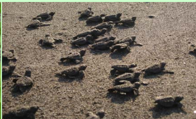
アカウミガメおよびその産卵地は県指定天然記念物です