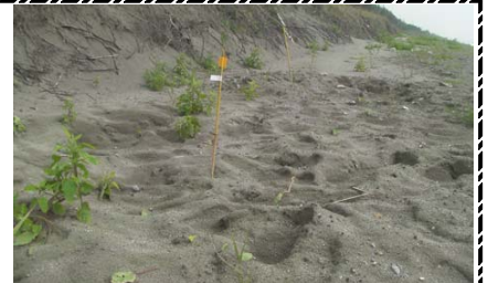
今年も養浜実施箇所であカウミガメが産卵しています！

平成23年6月21日 第25号 国土交通省 宮崎河川国道事務所 宮崎海岸出張所発行