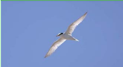
コアジサシ 宮崎県レッドリスト：絶滅危惧ⅠB類