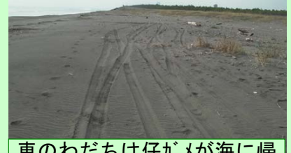
車のわだちは仔ガメが海に帰る時やコアジサシの産卵・子育てに影響を及ぼします！