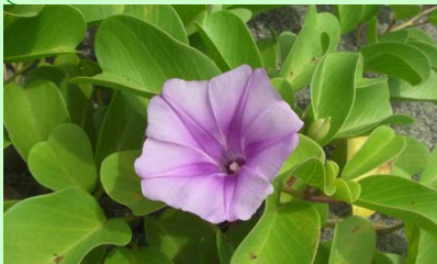
ゲンバイヒルガオ 宮崎県レッドリスト：絶滅危惧ⅠB類

一方で、ゴミの不法投棄や、砂浜への車の乗り入れなどが環境におよぼす影響を指摘されています。