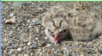
コアジサシは、砂浜や河原で産卵・子育てをします