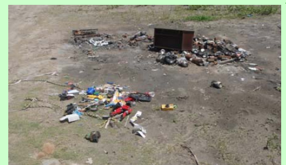
ゴミの投棄は不法行為で罰せられます！