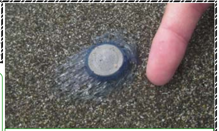
ギンカクラゲが多数漂着！