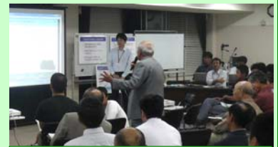
談義所で意見を述べる参加者