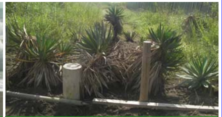
車の乗り入れを防ぐユッカ