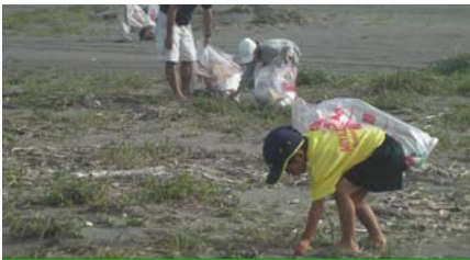
こどもたちも頑張りました！

美しくする会は、海岸に関心をもってもらうには「多くの人びとに海岸に目を向けてもらうことが重要」との認識から、今後もこのような活動を実施します。