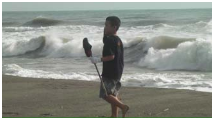
砂浜を裸足で歩いて最高！