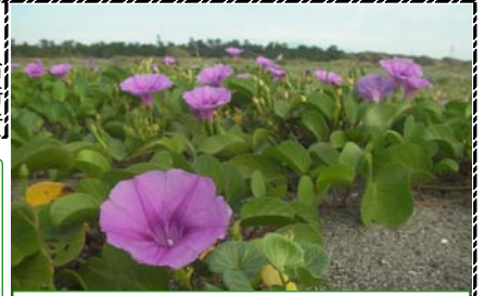
ビーチクリーン活動を見守る