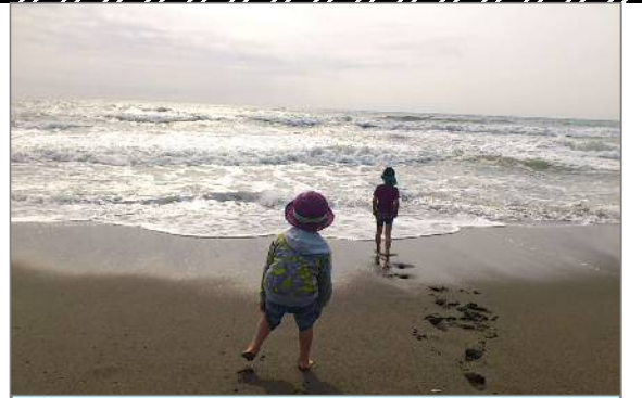
子供達のために美しい海岸を

平成24年5月21日 第34号 国土交通省 宮崎河川国道事務所 宮崎海岸出張所発行