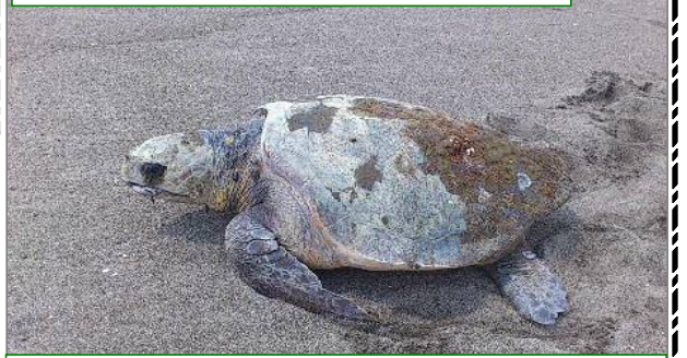
今年も産卵に来ました！