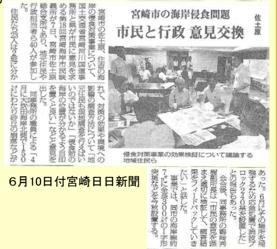
6月10日付宮崎日日新聞