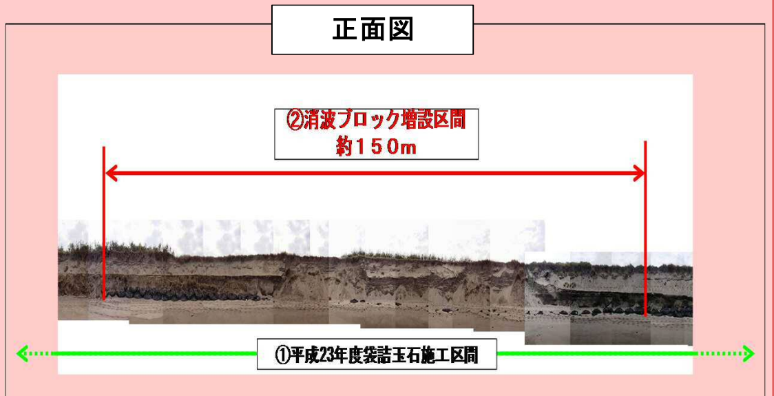
補強工事完了後現地写真 (H24. 6. 6 撮影)