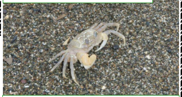
素早い動きのスナガニ