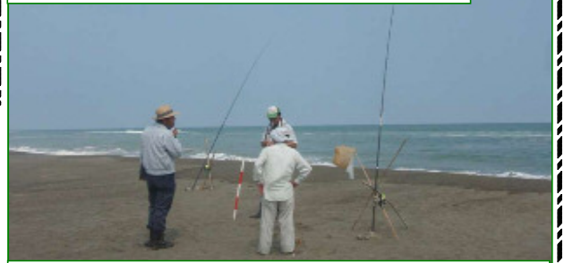
職員による海岸巡視を毎週行っています。 お気軽にお声かけください。