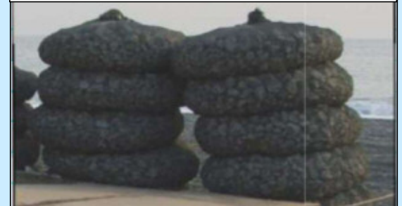
②袋詰玉石のイメージ

こぶし大の石をネットに詰めたもの。主に洗掘（流水で土砂が削り取られる現象）対策として用いられます。