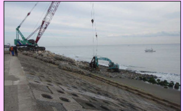
突堤建設工事 (H24.12.11現在)