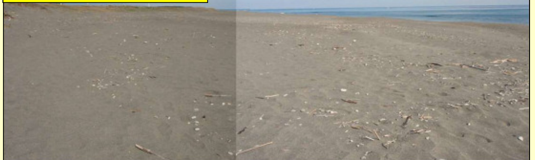
来年もたくさんのアカウミガメが産卵してくれることを願っています。