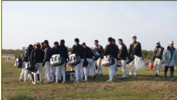
偶然、野球部の練習に訪れた高校生も飛び入りで参加してくれました。