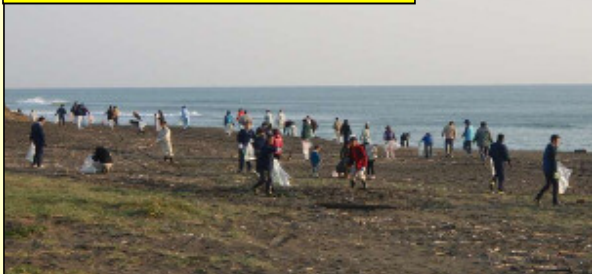
1 kmを超える広い範囲の砂浜ですが、大人数でゴミを収集。