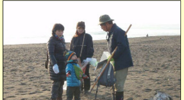
アカウミガメの質問をする子供。この子たちの未来に、美しい砂浜を。