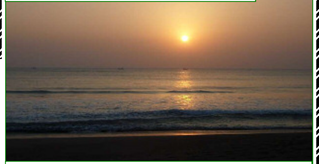
朝日でオレンジ色に染まる海