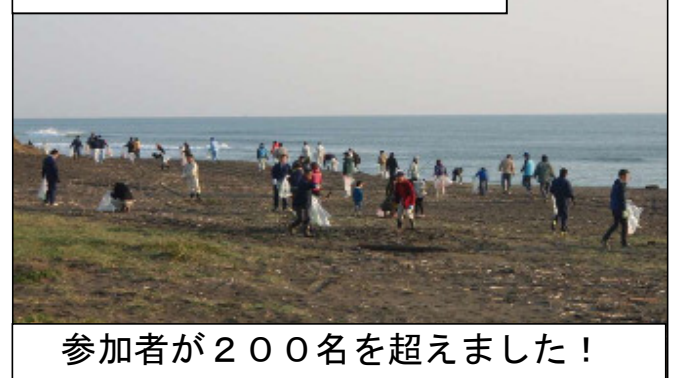
参加者が200名を超えました！

みなさんの協力により綺麗になった砂浜で、 去年はたくさんの卵を産むことができました。 今年もご協力よろしくお願います。