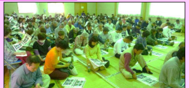
約180世帯の方々が参加しました。