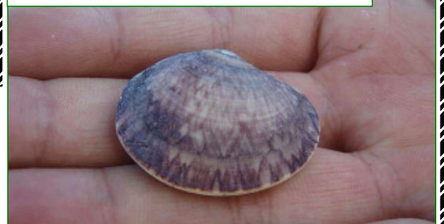
生きているワスレガイを見つけました。