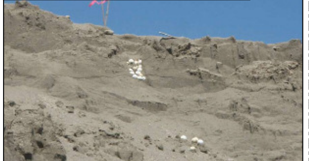
侵食で被害を受けたアカウミガメの卵