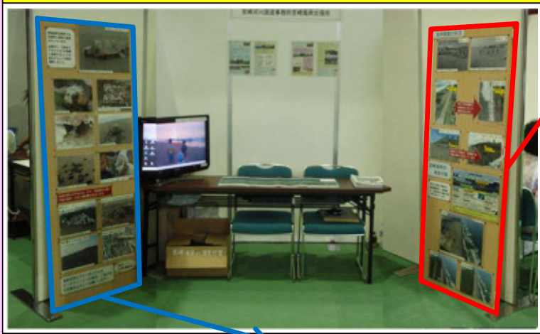
宮崎海岸出張所の展示ブース

侵食対策の一環として行っている、環境への配慮や利用者のマナー向上を目的とした取り組みについて、事例を紹介しました。