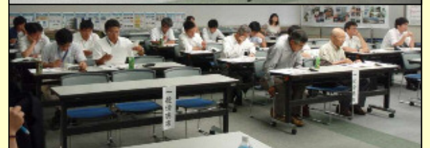
一般の方も傍聴されていました。

両分科会の検討結果が委員会です承されれば、埋設護岸については大炊田地区で10月に工事に着手することとなり、効果検証については今年度から本格的に運用を開始することとなります。