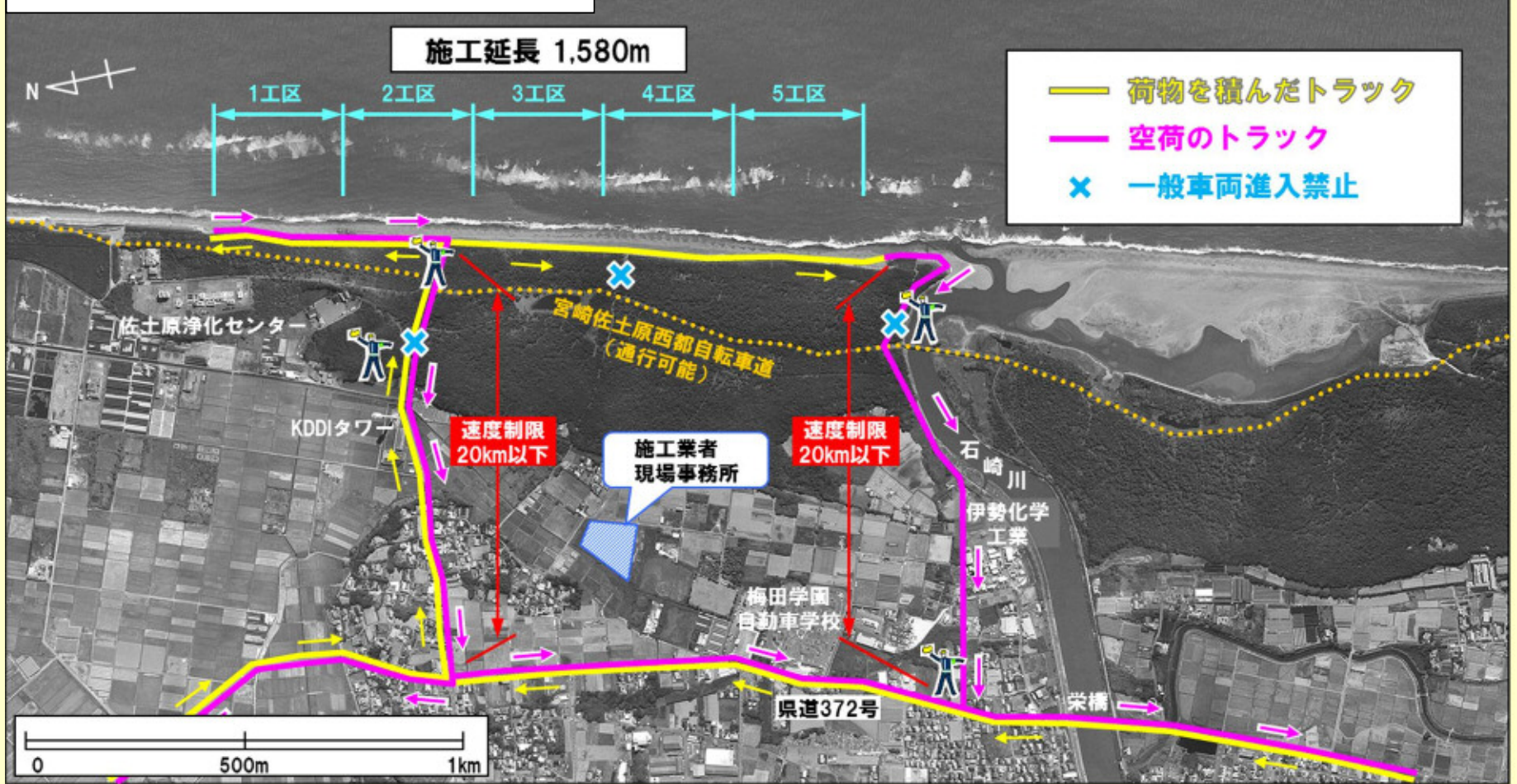
②工事用車両通行経路図 (大炊田地区)