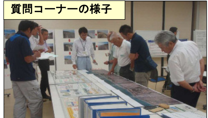
質問コーナーの様子