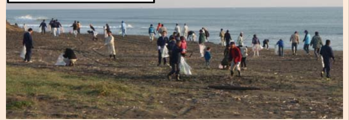
ビーチクリーンの様子

駐車場は、石崎の杜 歓鯨館（旧石崎浜荘）の北側スペースです。 （砂利で舗装されている範囲）