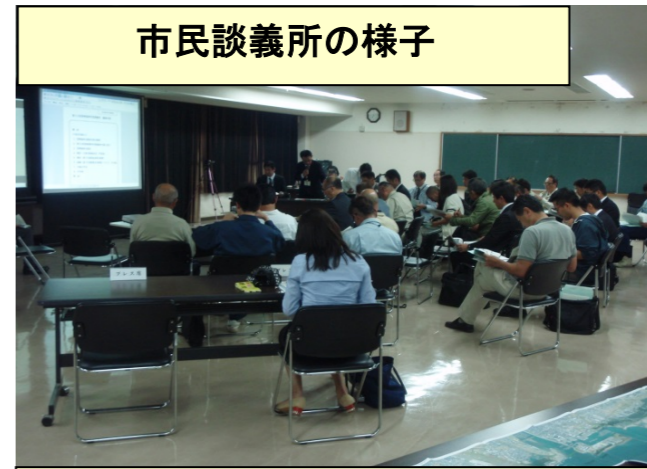
市民談義所の様子

談義中、侵食対策検討委員会の委員である漁業者へのインタビューが行われ、漁業の方法や突堤が延長することで考えられる支障について質問することにより意見の共有が行われました。