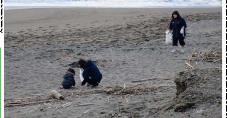
お母さんと一緒に砂浜をお掃除