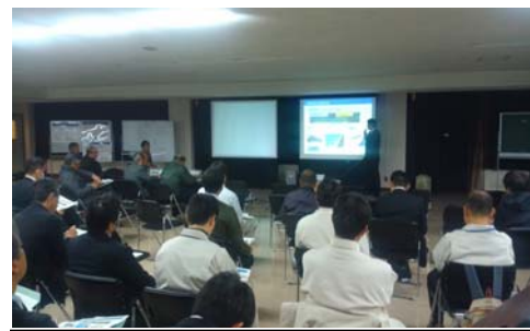
談義所の市民参加者は34名でした