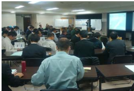
市民談義所の様子

それに対し「河川改修土砂を活用、県内で調整し必要量を確保する。」「海からも養浜はしており効果を確認するための測量も行っている。」「宮崎港には砂が流入しているが、浜崖を守るためには養浜は不可欠。大型船が入れないのは砂の問題ではなく、港の規格の問題。」など説明しました。