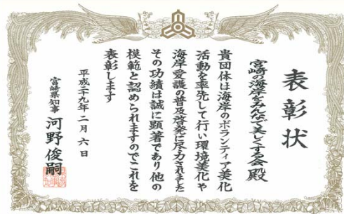
宮崎県知事より表彰状をいただきました