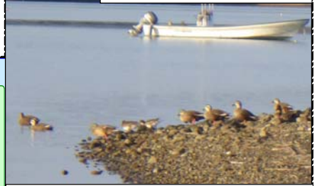
越冬するカモたち