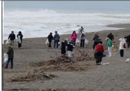
ビーチクリーン(H28.11.26実施)の様子