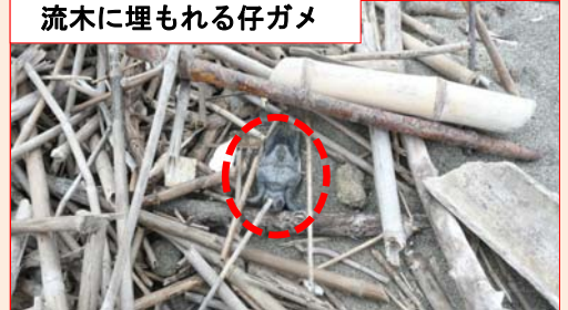
流木に埋もれる仔ガメ