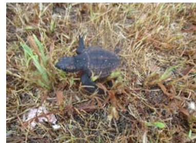
昨年のビーチクリーンでも見ることができました

運良く見つけることができた場合は、進む道を邪魔しないようにそっと見守りましょう。