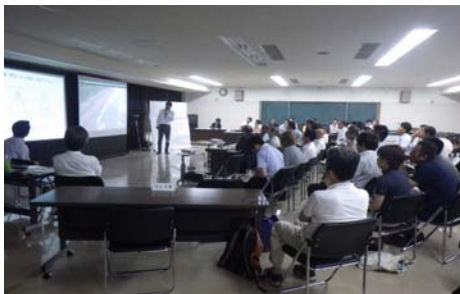
談義所の市民参加者は19名でした

※会議の開催前30分程度で、初参加の方と以前から参加の方との知識のギャップを埋め、市民談義所への理解を深めてもらうため、来場者を対象とした相談窓口として「何でも質問コーナー」を開設しています。