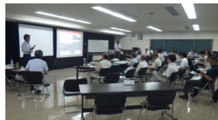
談義所の市民参加者は11名でした

※各種会議の議事概要は、宮崎河川国道事務所ホームページに随時掲載しています。 当日の配付資料や「宮崎海岸の侵食対策」に関する資料についても、閲覧できます。