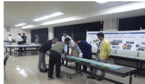
会議前に「何でも質問コーナー」を開設しています