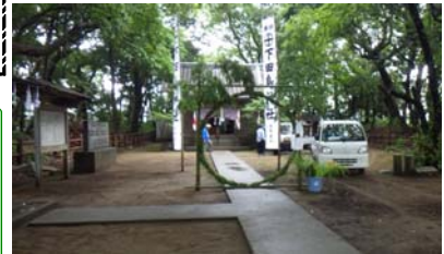
夏越しの大祓 茅の輪くぐり