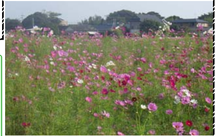
H29.10.11大炊田交差点付近にて撮影