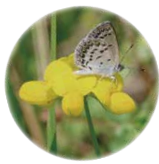
ミヤコグサで吸蜜するシルビアシジミ

大淀川「水辺の楽校」の環境を、大淀川河川敷に昔から生息する植物やシルビアシジミを含めた多くの生き物が見られるようにすることで、子どもたちへの自然観察の場所にしたい。