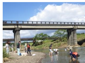
皆さんで水生生物採集！