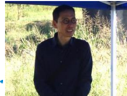
平岡委員長から開会ご挨拶