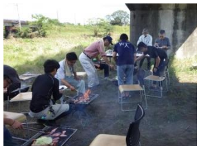
学習後は河川敷広場でBBQ♪