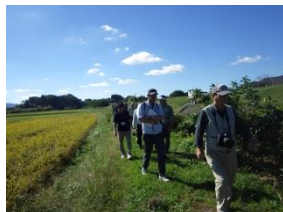
川の駅対岸のあぜ道を歩きます