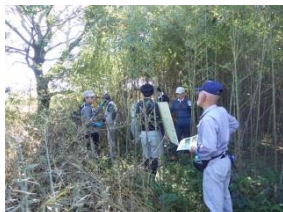
合流点の水路付近は、険しい竹藪になっていました