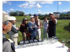
捕まえた魚類・水生生物の観察♪楽しい観察でした♪