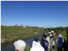
対岸から見る拠点の風景はまた違う味わいです