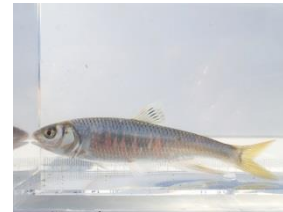
一番多く捕れたオイカワ。地元では八工と呼ぶそうです！