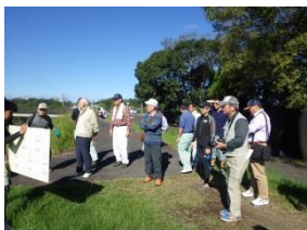
整備内容を再確認して…