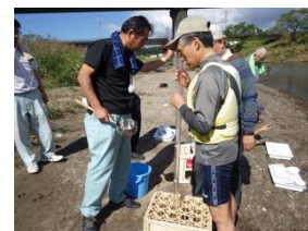
川の水の透明度を測ります