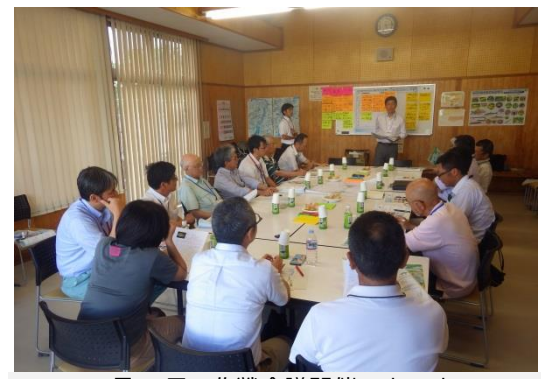
6月30日の作戦会議開催の様子