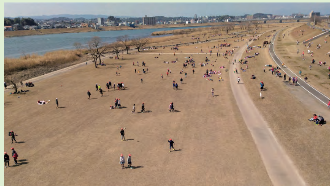
平成 29 年ころの大淀川河川敷