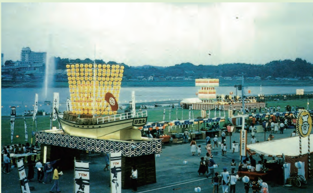
昭和のまつり宮崎