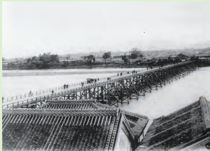
大正 5 ～ 6 年ころの橋樑