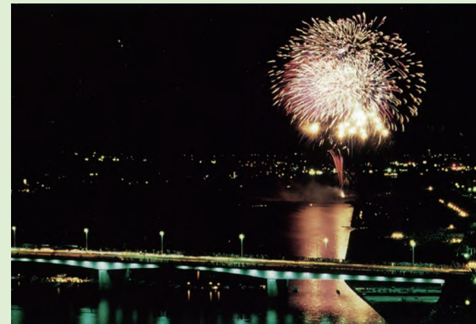
昭和の大淀川花火大会