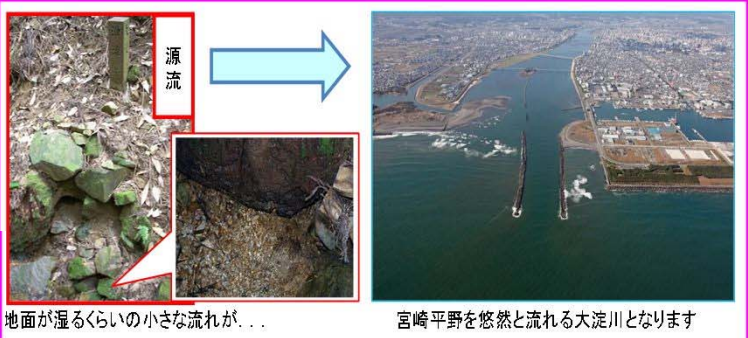
地面が湿るぐらいの小さな流れが...