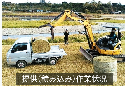
提供(積み込み)作業状況