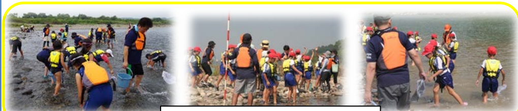
子どもたちによる水生生物調査

川の汚れの程度を測る代表的な尺度です。水中の汚れ（有機物）は、微生物により分解されますが、その時に消費する酸素の量をBODと言い、BODの値が大きければ水が汚れていることを表します。