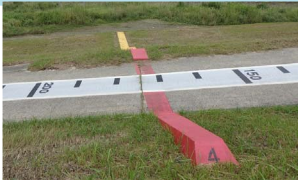
危険度レベル表示設置(大淀川左岸27K400付近)

分かり易い河川水位の情報を提供し、地域の方々の避難行動や関連市町の避難勧告判断に寄与できるよう、水位危険度レベルの現地表示及び堤防天端からの高さ表示と説明看板の設置を行っています。高岡出張所管内では浦之名地区に設置されています。