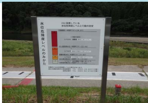
説明看板(大淀川左岸27K400付近)