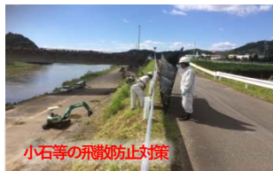
小石等の飛散防止対策