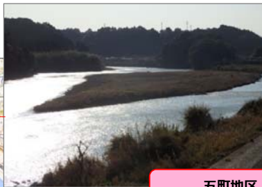
五町地区 土砂撤去