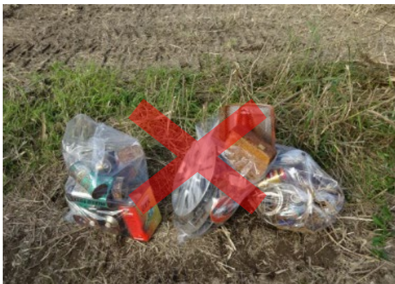
廃棄物や家庭ゴミ