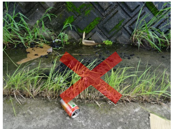
バーベキュー等のゴミ