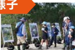
タコノアシ観察会