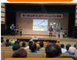
九州「川」のワークショップ