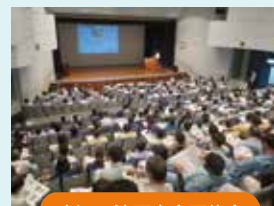
水辺工法研究会研修会