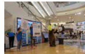
ふるさとの水辺オープニング