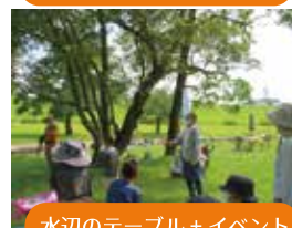
水辺のテーブル+イベント