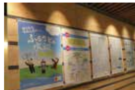
ふるさとの水辺パネル展示