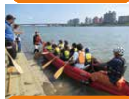
E ボート体験 (大淀川フェス)