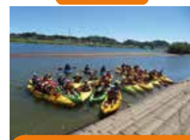
カヌー体験 (修学旅行受け入れ)