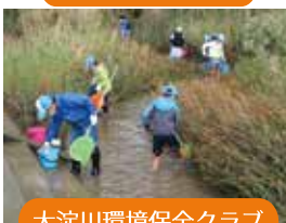
大淀川環境保全クラブ