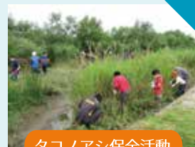
タコノアシ保全活動