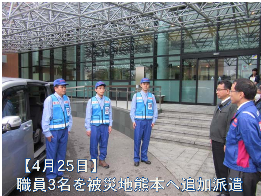
【4月25日】 職員3名を被災地熊本へ追加派遣