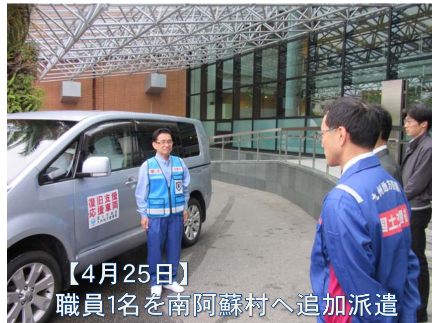
【4月25日】 職員1名を南阿蘇村へ追加派遣