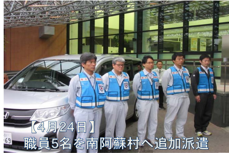
【4月24日】 職員5名を南阿蘇村へ追加派遣