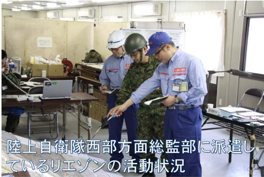
陸上自衛隊西部方面総監部に派遣しているリエゾンの活動状況