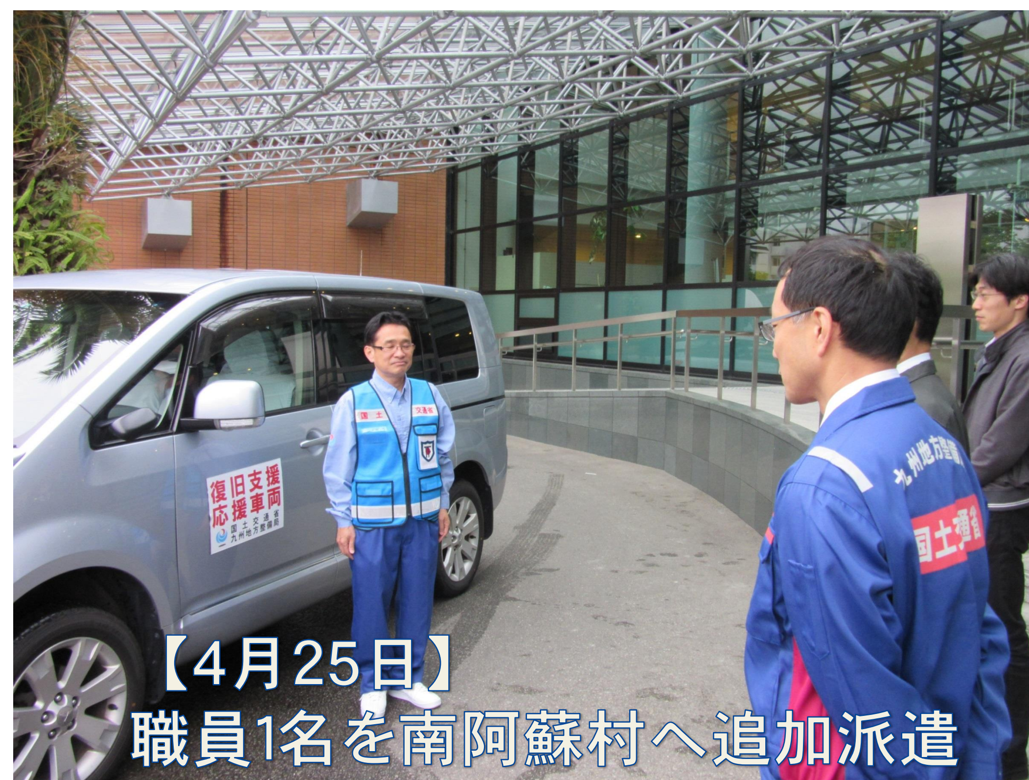
【4月25日】 職員1名を南阿蘇村へ追加派遣