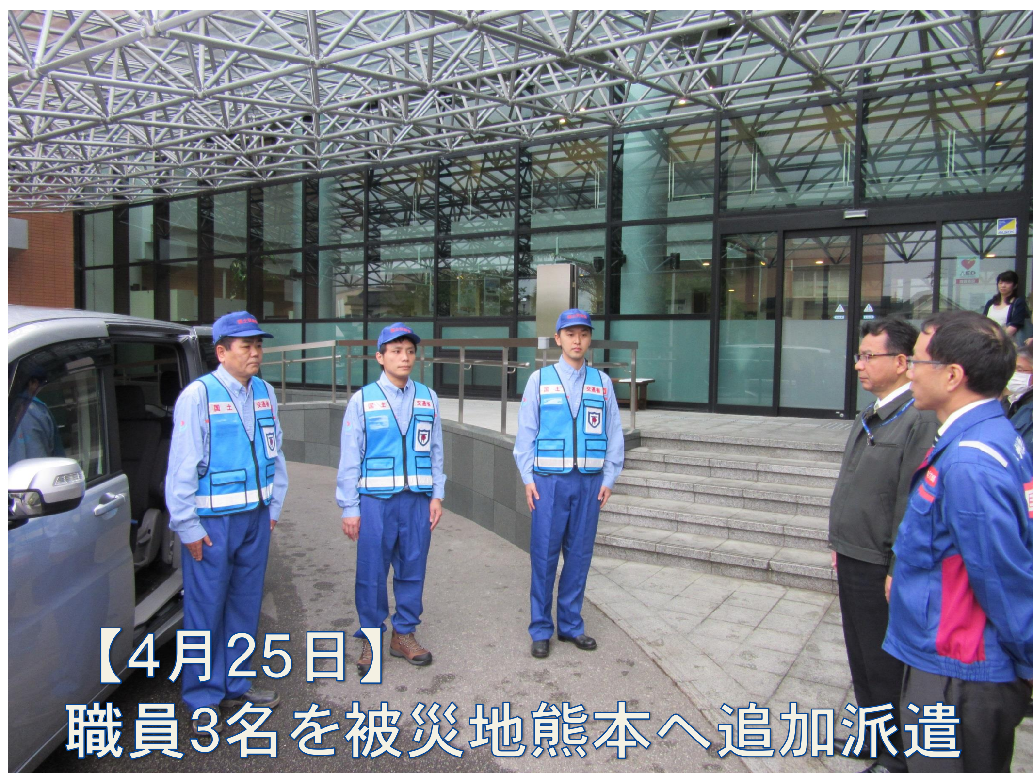
【4月25日】 職員3名を被災地熊本へ追加派遣