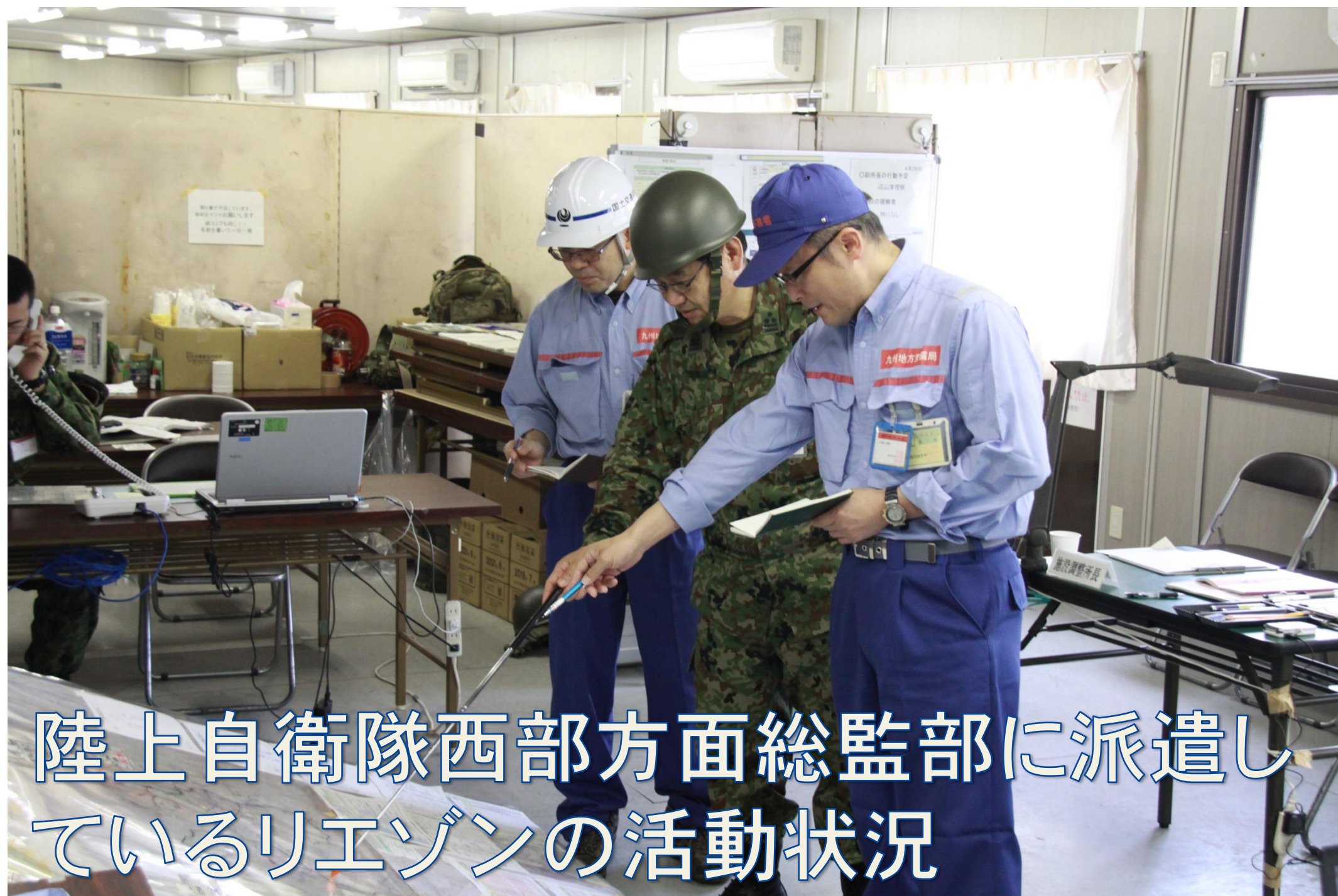
陸上自衛隊西部方面総監部に派遣しているリエゾンの活動状況