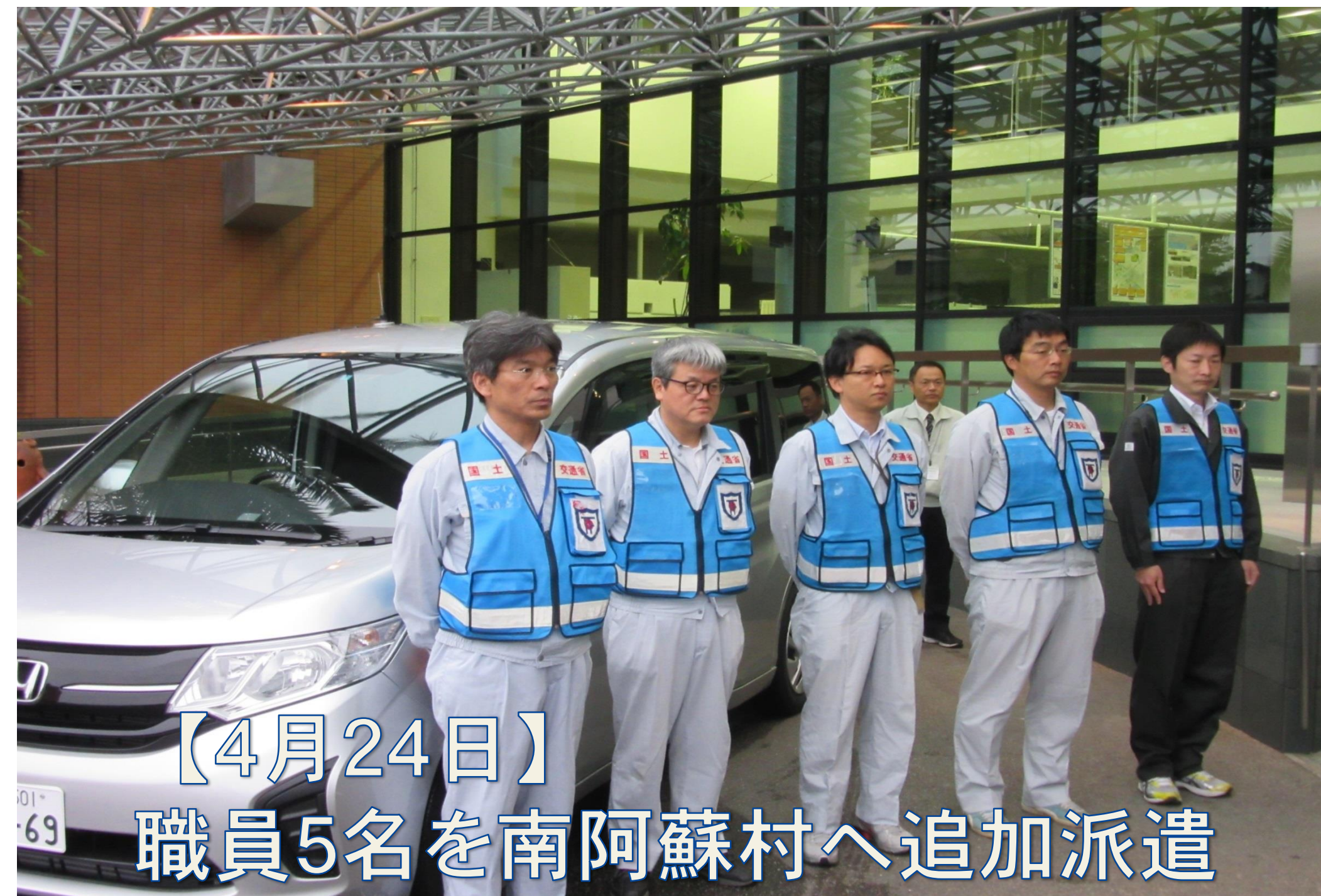
【4月24日】 職員5名を南阿蘇村へ追加派遣