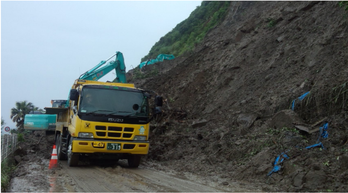
《土砂撤去状況⑥》 6月23日13時