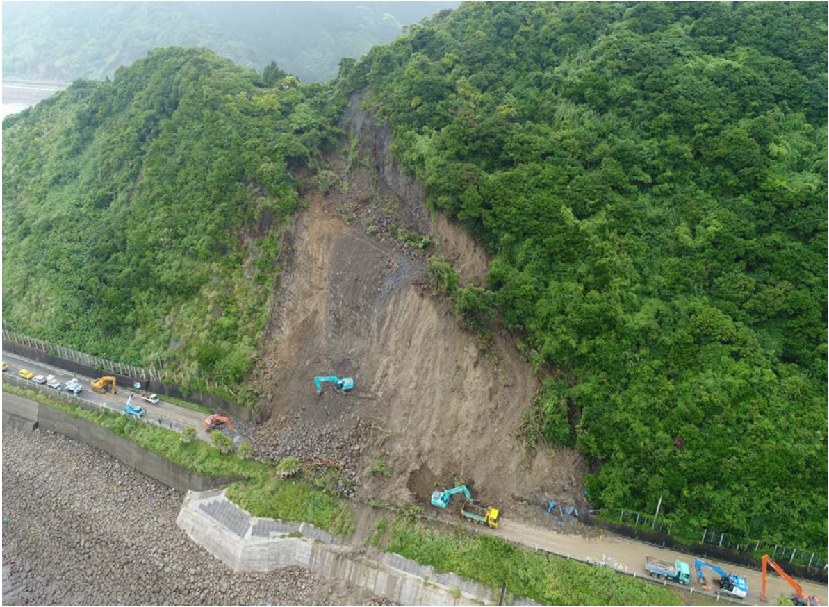
《土砂撤去状況②》 6月23日11時