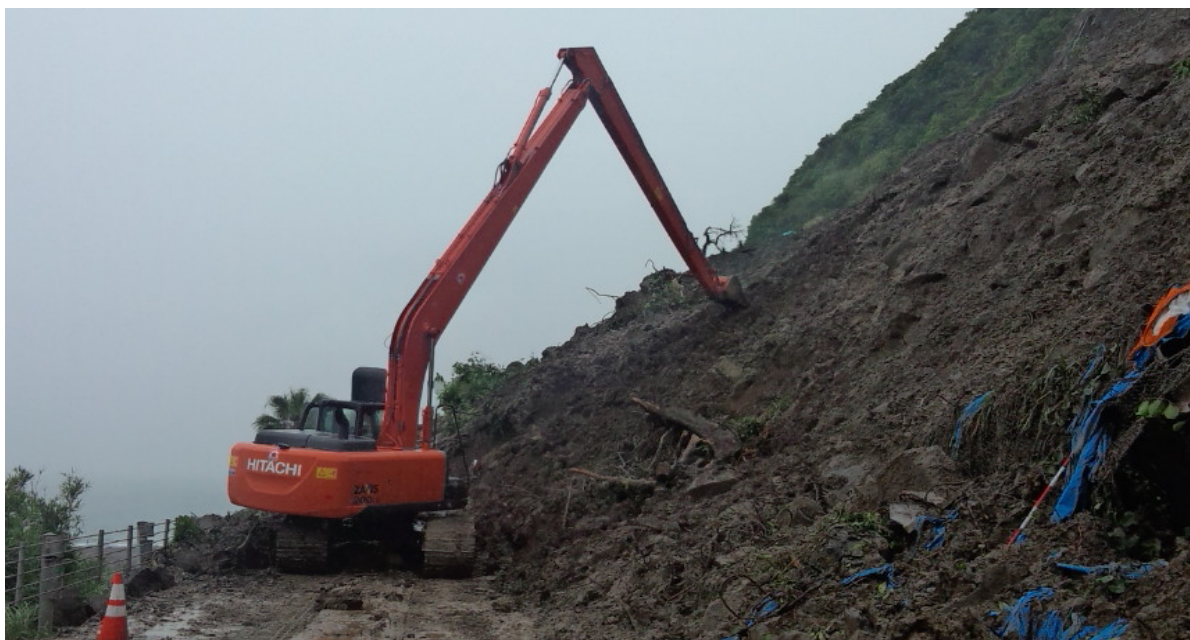
《土砂撤去状況⑤》 6月23日12時