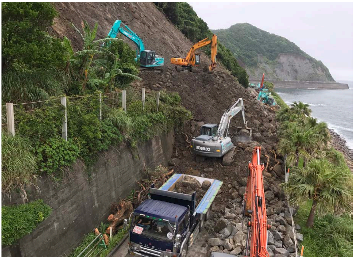
《土砂撤去状況⑨》 6月23日17時