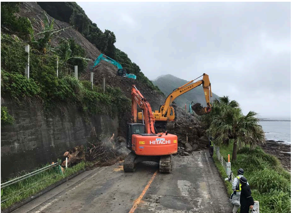
《土砂撤去状況⑦》 6月23日14時