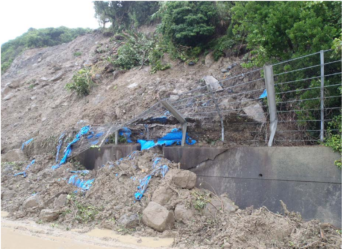
《宮崎市側から》 6月23日9時頃