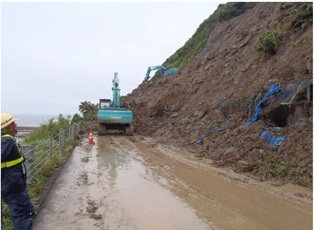
《土砂撤去状況①》 6月23日10時