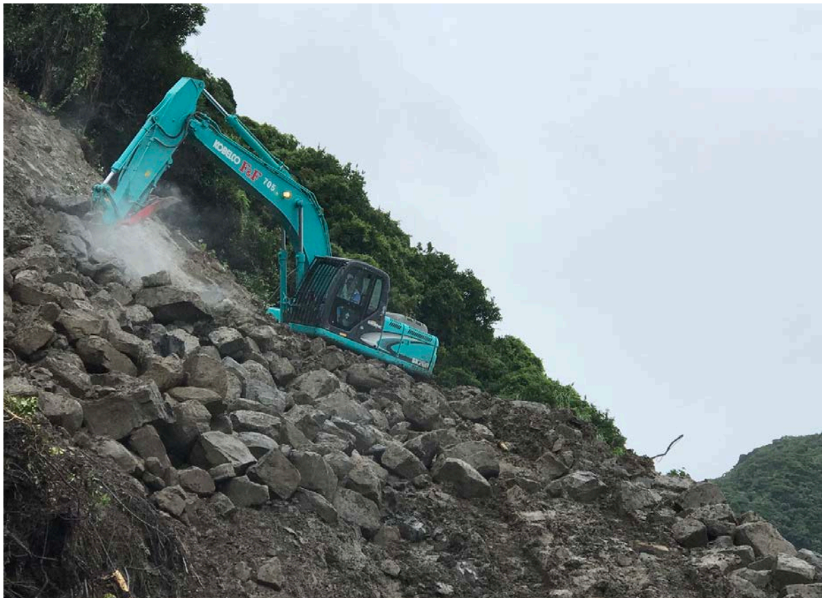
《土砂撤去状況④》 6月23日12時