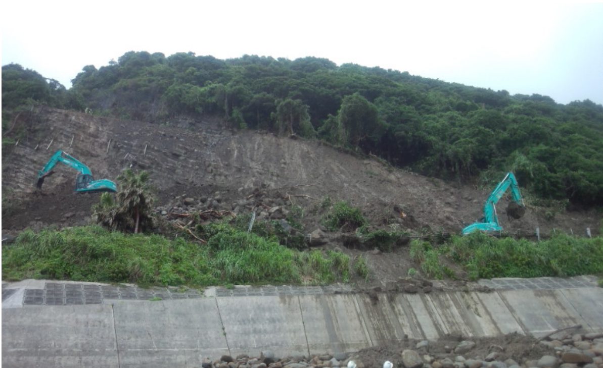
《土砂撤去状況③》 6月23日12時