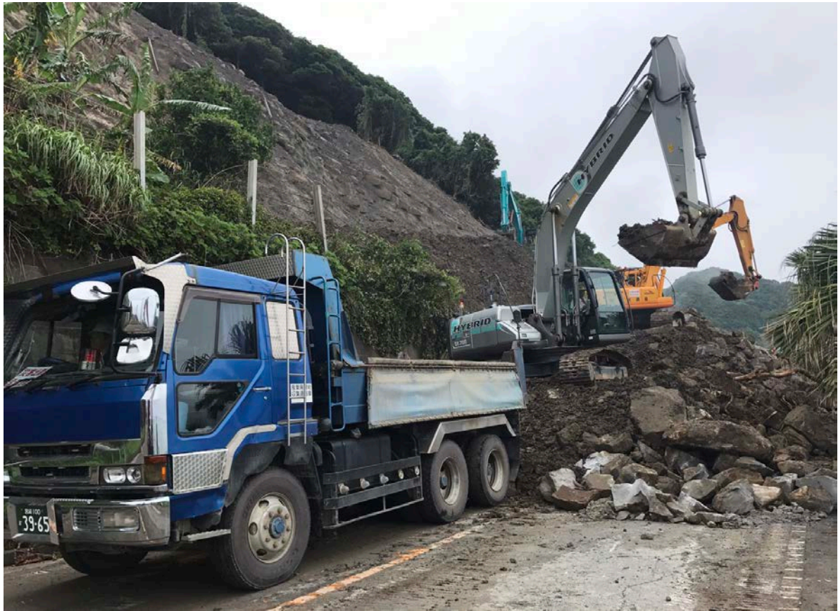
《土砂撤去状況⑧》 6月23日14時