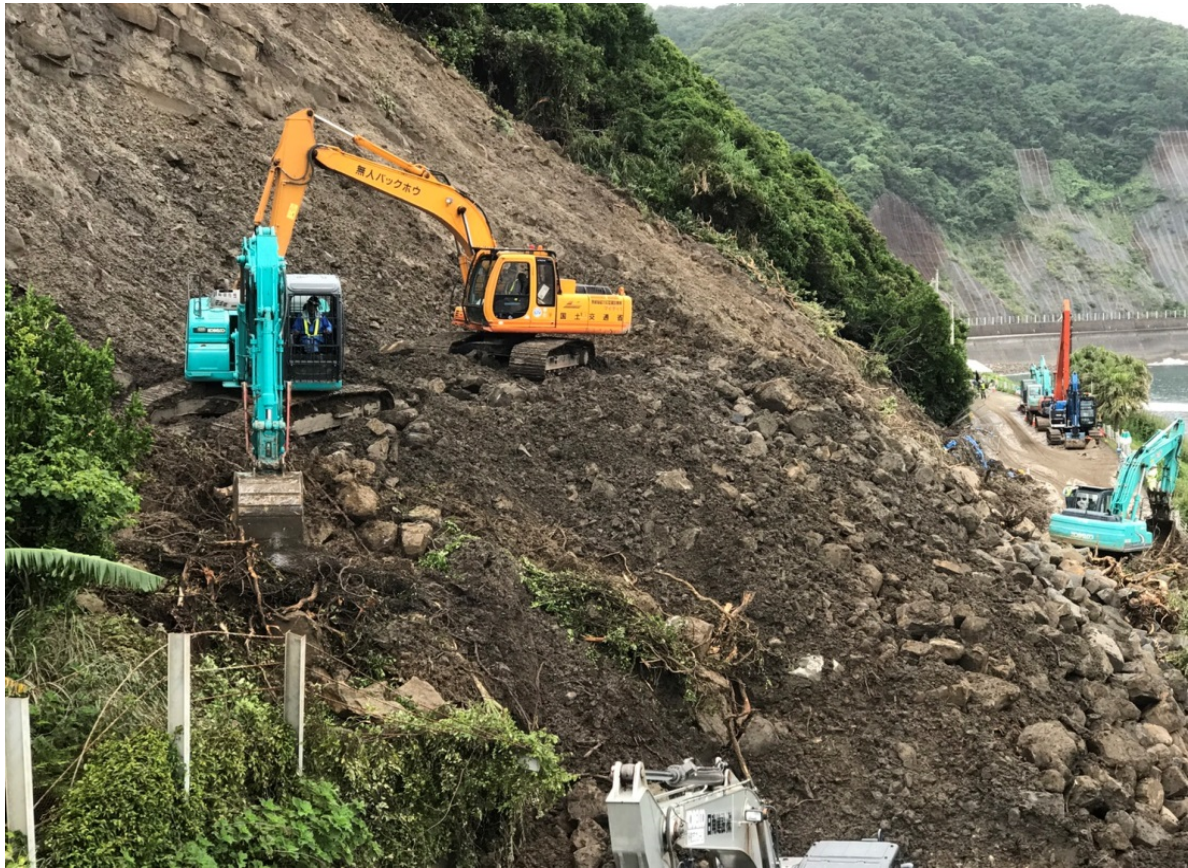
《土砂撤去状況⑩》 6月23日17時