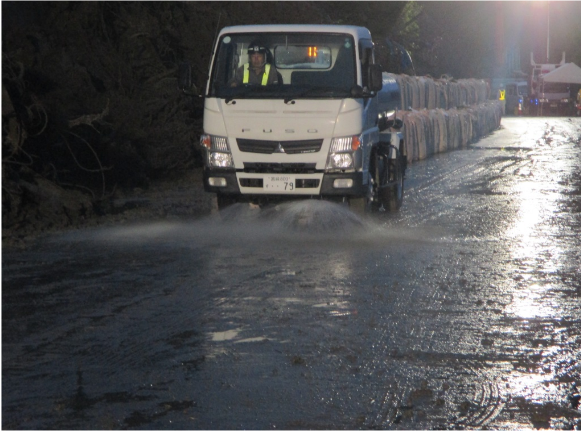
《土砂撤去完了状況③》6月26日5時頃