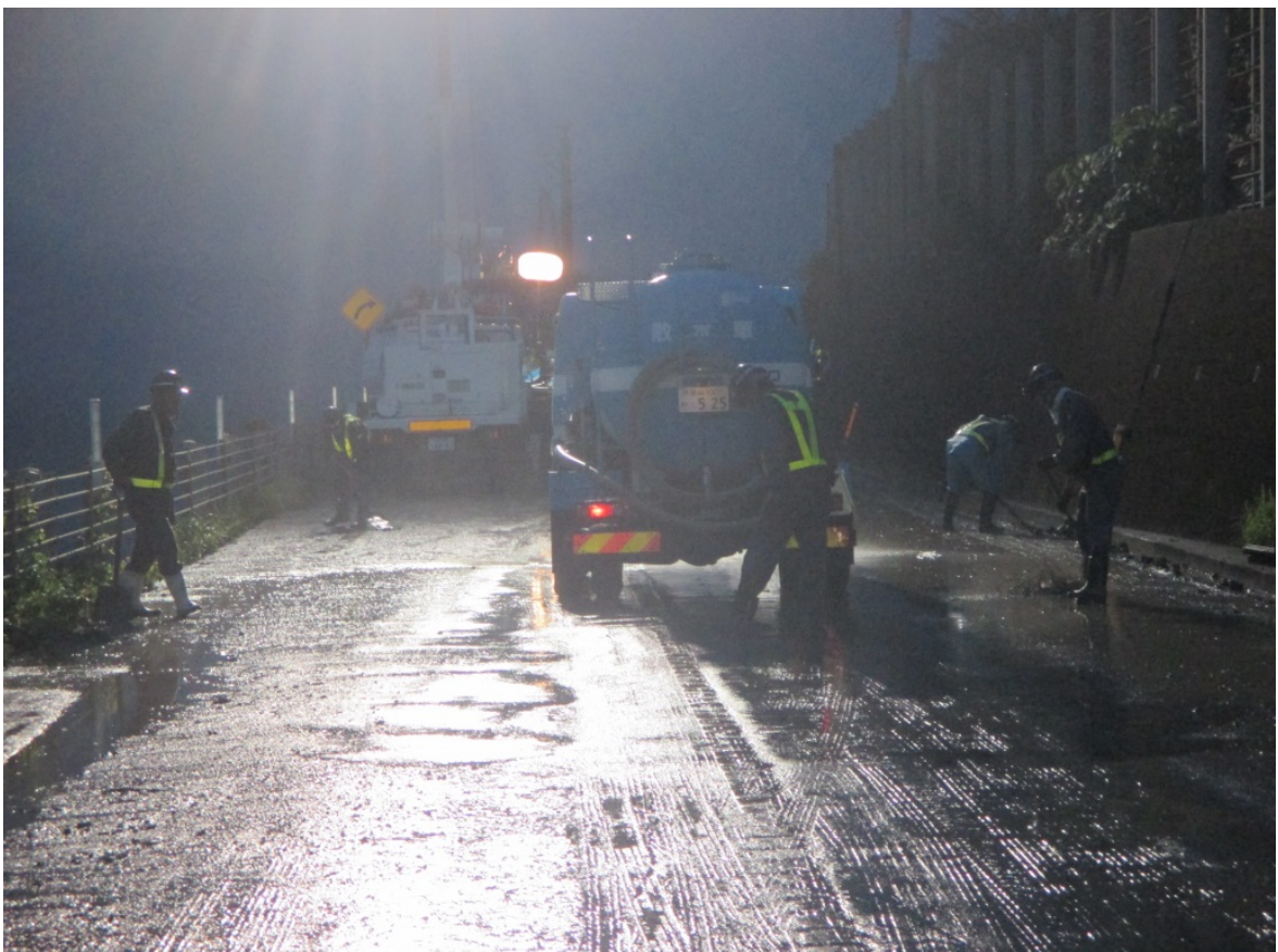
《土砂撤去完了状況②》6月26日5時頃