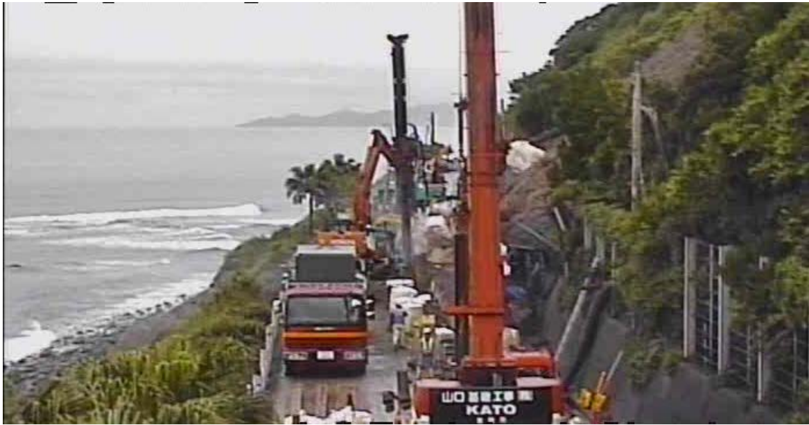
《仮設防護柵設置状況②》6月26日18時頃