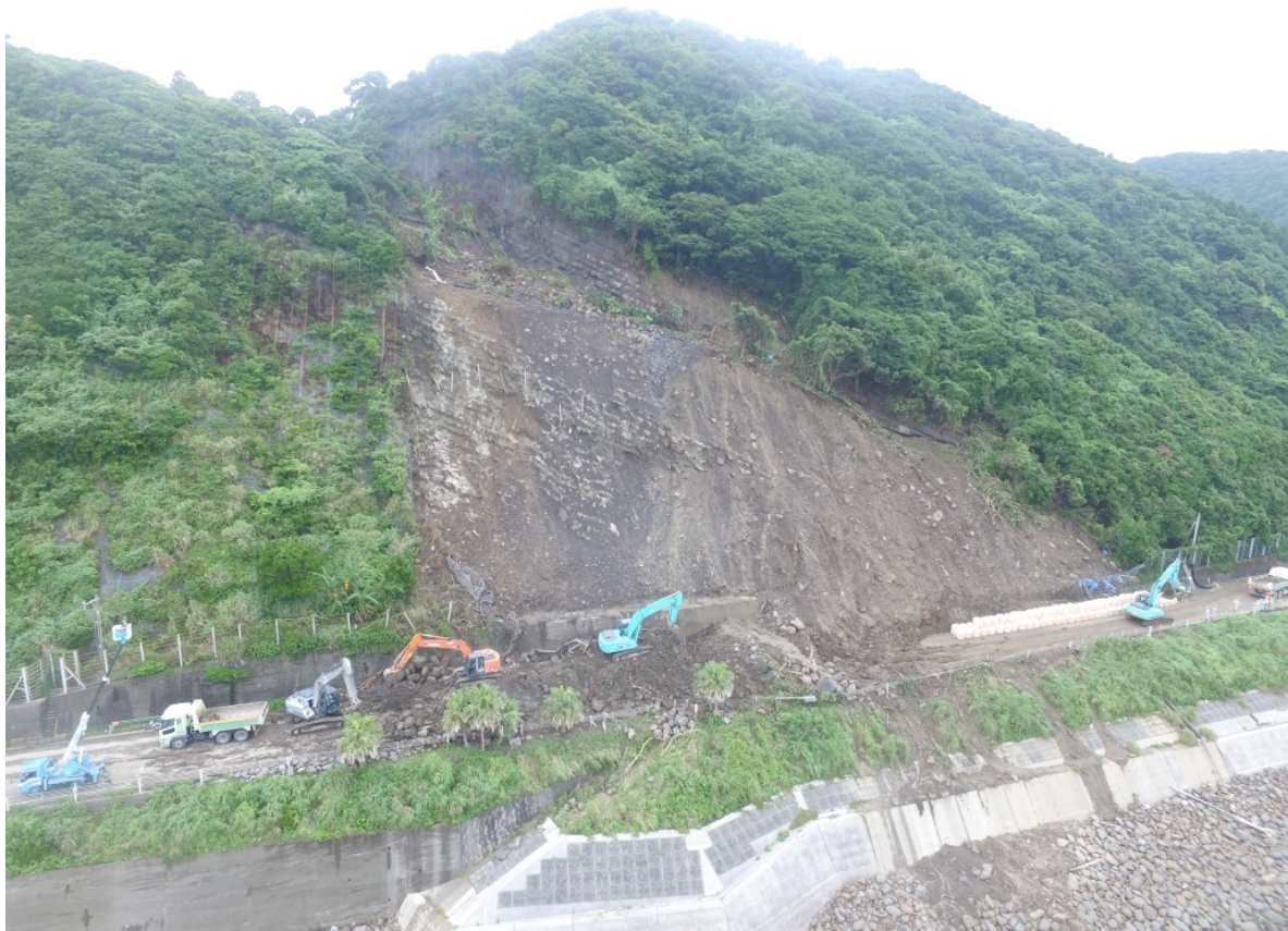
《土砂撤去及び大型土のう設置状況④》 6月25日16時頃