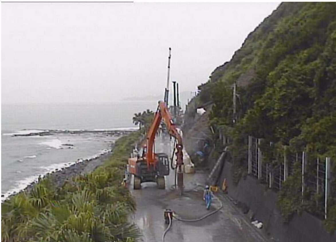
《仮設防護柵設置状況①》6月26日11時頃