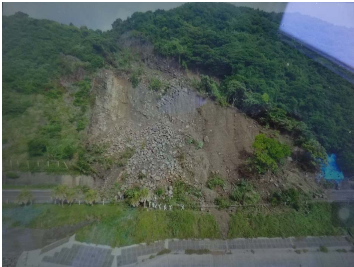
《海側からの全景①》6月21日9時頃