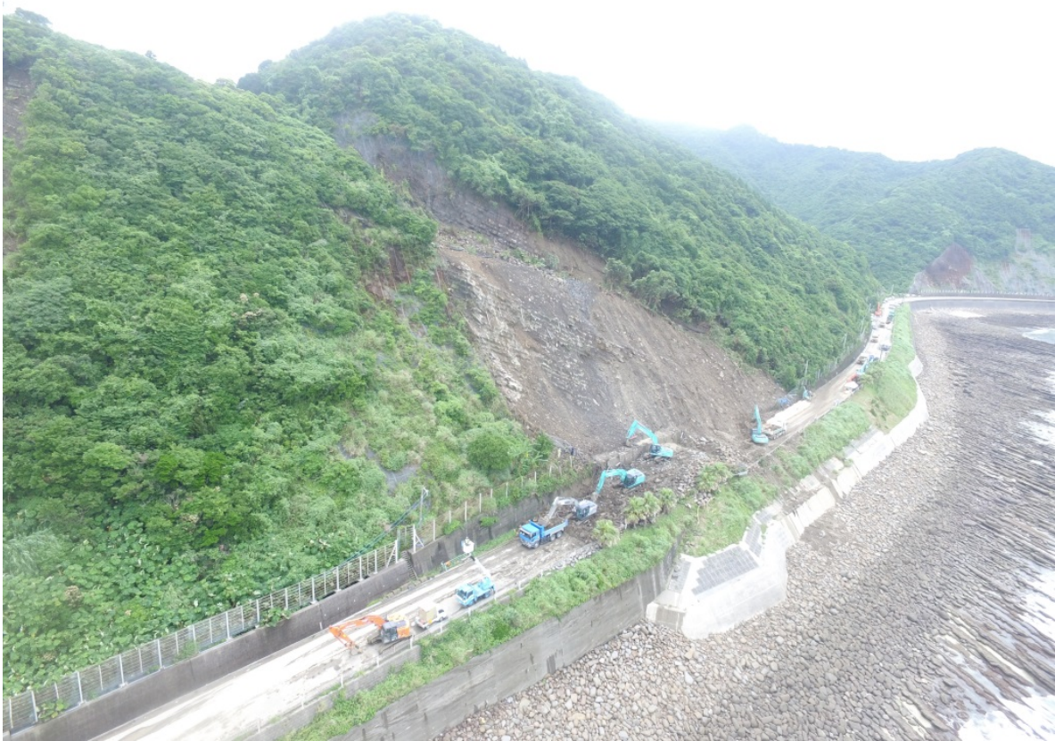
《土砂撤去及び大型土のう設置状況②》 6月25日13時頃