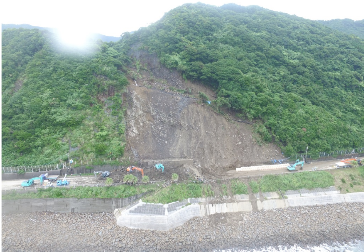
《土砂撤去及び大型土のう設置状況③》 6月25日16時頃