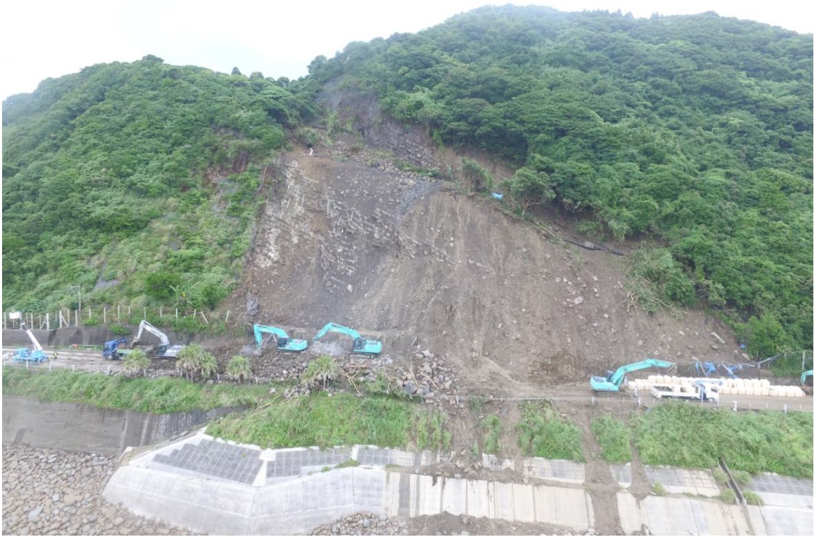
《土砂撤去及び大型土のう設置状況①》 6月25日13時頃