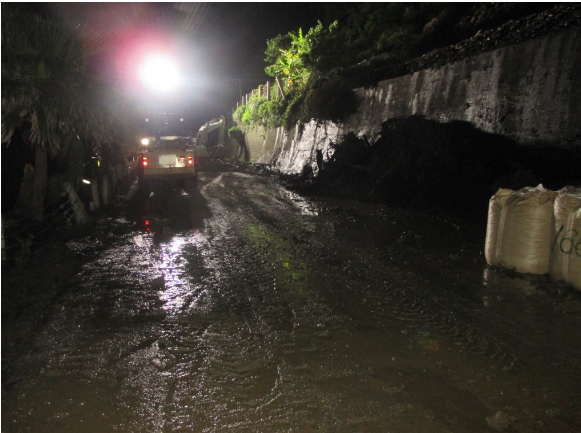
《土砂撤去完了状況①》 6月26日5時頃