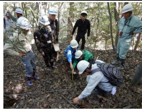
九州地整と学識者による現地調査状況