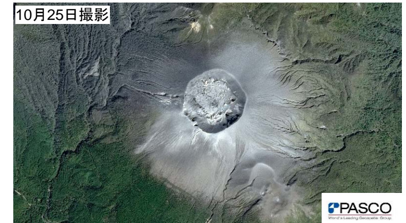
光学衛星による降灰状況の確認