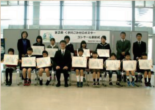
【熊本県】球磨川 次世代のためにがんばる会

河川協力団体は市民と河川管理者、双方の立場を理解し、活動しています。市民と河川管理者の間に立つことで、お互いの視点や想いを融合することが出来ます。その結果、河川の利活用や維持・管理につながります。