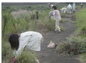
外来植物調査・駆除

水生生物の調査研究や、生態系を維持するために外来生物の駆除活動などを行い、河川の環境を維持します。