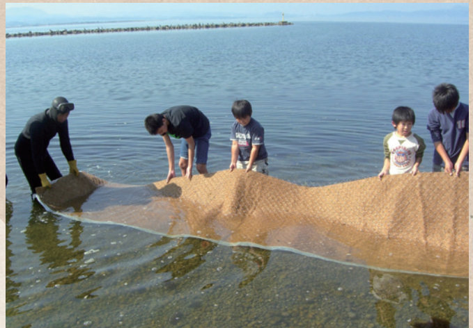
【鳥取県・島根県】中海 NPO法人 未来守りネットワーク

河川協力団体によるアマモ場再生への取り組み。作業に地域の子ども達も参加することで、自分達が住む地域への関心や、自然環境に対する意識の向上につながっている。