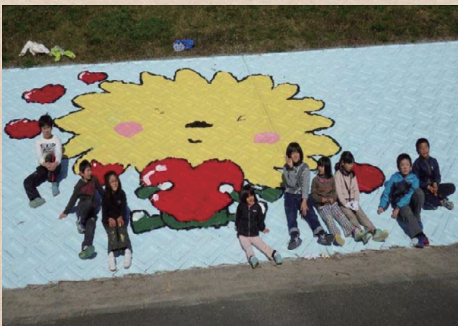
【徳島県】桑野川 横見町をきれいにする会

誰でも、いつでも気軽に近づく快適な河川空間は維持・管理が重要です。河川協力団体が実際の作業を行うにあたって、河川管理者と河川協力団体が協力して計画を作成するなど、両者が一体となって安心・安全な河川空間の維持・管理の質の向上につながっています。