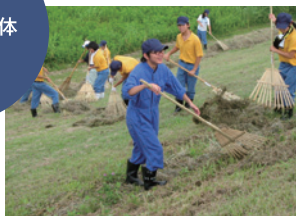
河川の除草・集草