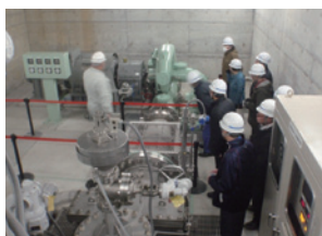
河川・ダム管理状況説明

過去の水害などの伝承や、防災に関わる活動、またダムなど河川にある施設での説明会などを実施します。