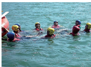
水辺の安全利用講習会

河川や河川空間を使って、観察会や、安全に河川を利用するための講習会などを実施します。