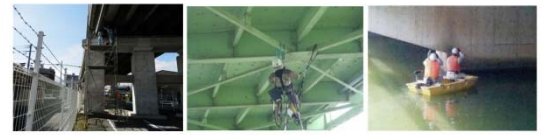
足場設置による点検 特殊高所技術による点検 小型船舶を使用した水上での点検