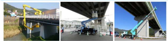
橋梁点検車による点検 リフト車による点検 高所作業車による点検

・特殊点検車両や船舶等で、みだんは見えない所も近づいて技術者が近接目視点検しています。