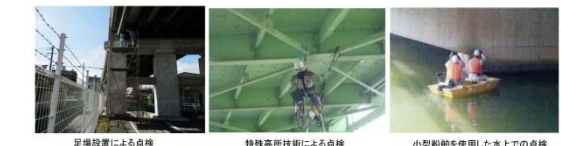
足場設置による点検