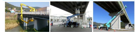
橋梁点検車による点検

◆特殊点検車両や船舶等で、みだんは見えない所も近づいて技術者が近接目視点検しています。