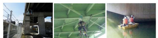
足場設置による点検