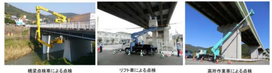
橋梁点検車による点検

・特殊点検車両や船舶等で、ふだんは見えない箇所近づいて技術者が近接目視点検しています。