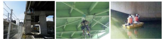
足場設置による点検