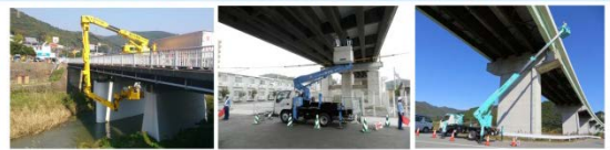
橋梁点検車による点検

・特殊点検車や船舶等で、ふだんは見えない所も近づいて技術者が近接目視点検しています。