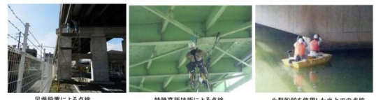
足場設置による点検