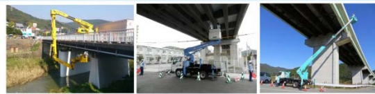
橋梁点検車による点検

・特殊点検車両や船舶等で、ふだんは見えない箇所について技術者が近接目視点検しています。