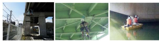
足場設置による点検