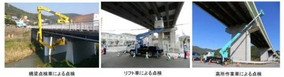
橋梁点検車による点検

・特殊点検車両や船舶等で、ふだんは見えない所も近づいて技術者が近接目視点検しています。