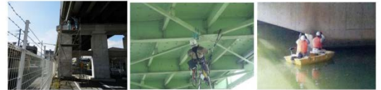
足場設置による点検