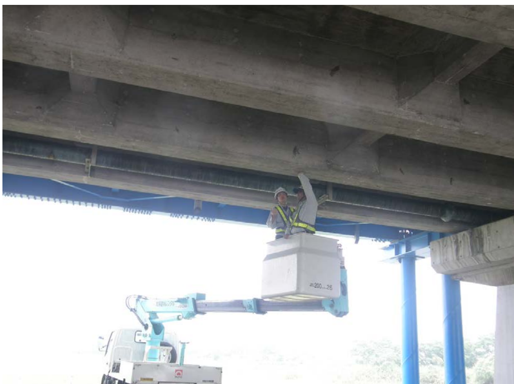
リフト車による点検