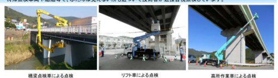
橋梁点検車による点検

・特殊点検車両や船舶等で、ふだんは見えない箇所近づいて技術者が近接目視点検しています。