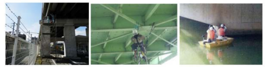
足場設置による点検