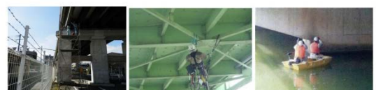
足場設置による点検