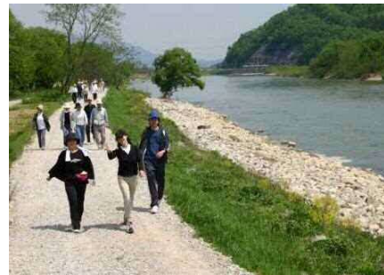
管理用通路をフットパスとして活用（最上川）

ソフト支援： 民間事業者による河川敷のイベント広場やオープンカフェの設置等、地域のニーズに対応した河川敷地の多様な利用を可能とするため、河川敷地占用許可準則第22による都市・地域再生等利用区域の指定等を支援。