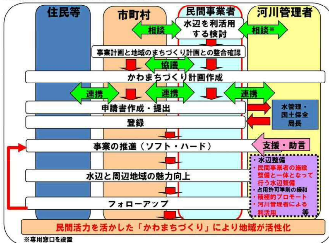
図：かわまちづくりの流れ