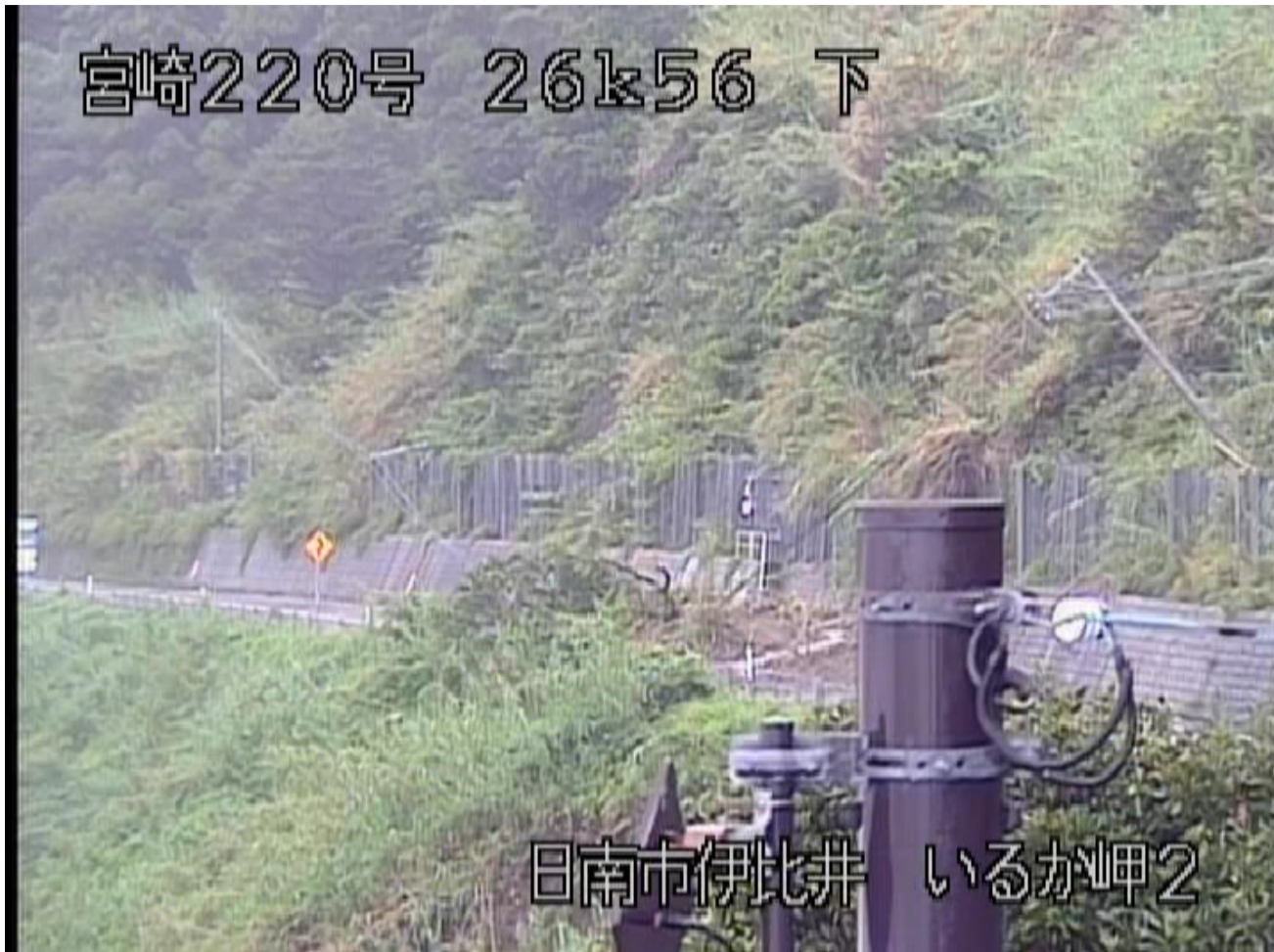
日南市大字伊比井字磯端の土砂流出 <10月29日7時40分頃>