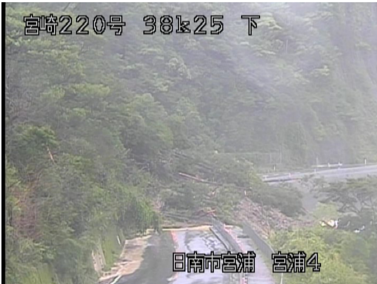
日南市大字宮浦字志戸辻の斜面崩壊 <10月29日7時40分頃>