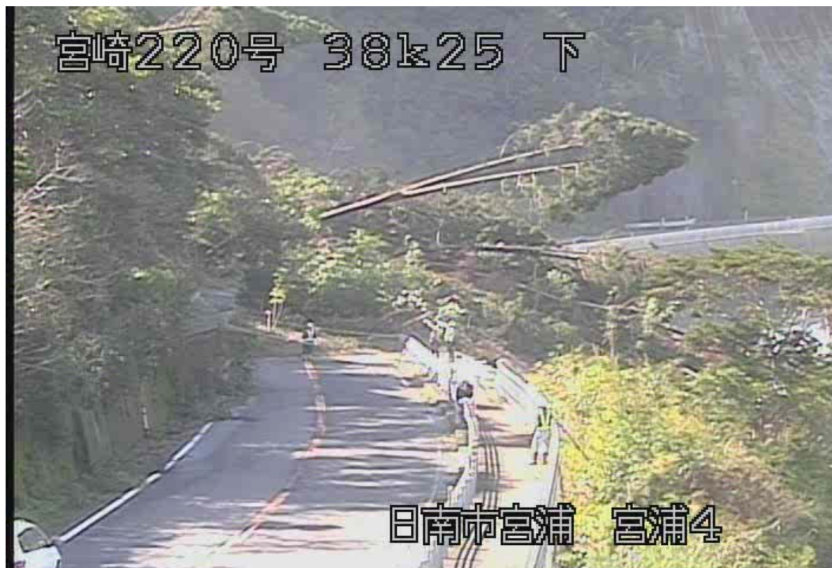
日南市大字宮浦字志戸辻の斜面崩壊（日南側） <10月29日 13時00分頃>