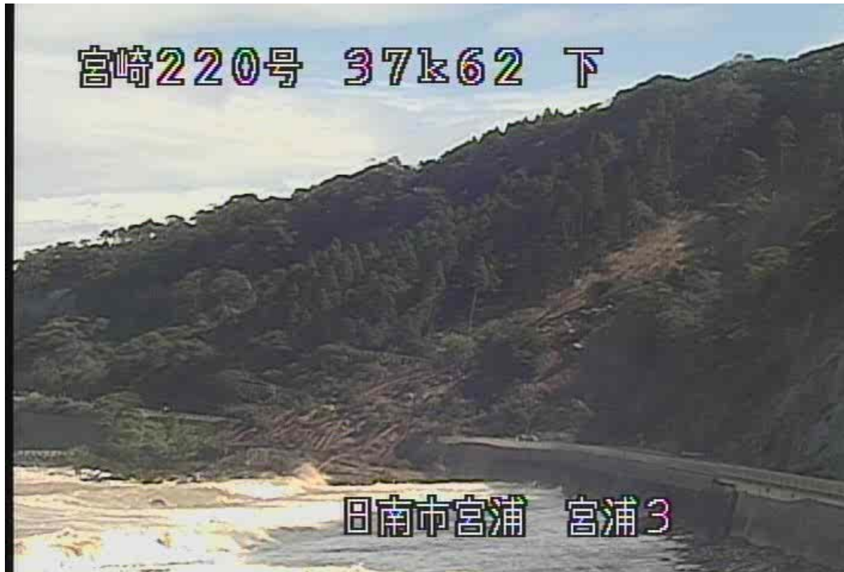
日南市大字宮浦字志戸辻の斜面崩壊（宮崎側） <10月29日 13時00分頃>