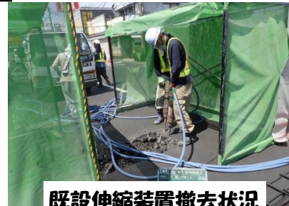
既設伸縮装置撤去状況