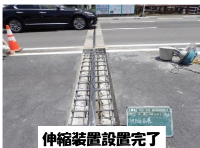
伸縮装置設置完了