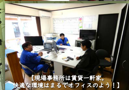
【現場事務所は賃貸一軒家。快適な環境はまるでオフィスのように！】