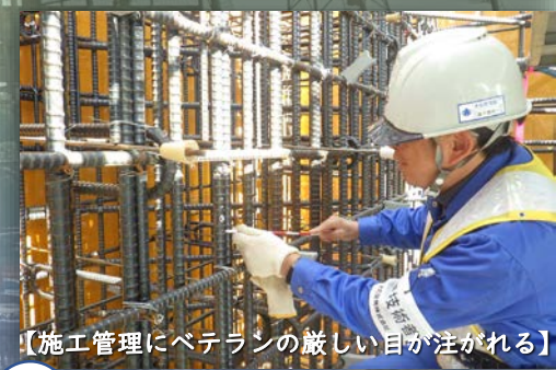
【施工管理にベテランの厳しい目が注がる】